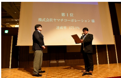
計画達成率部門 第1位 株式会社 ヤマチコーポレーション