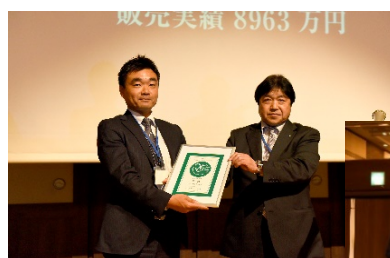
販売実績部門 第1位 株式会社 西山