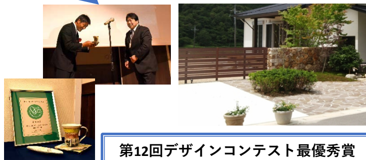
第12回デザインコンテスト最優秀賞

最優秀賞 盾 + 商品券10万円分 + 記念品 優秀賞 盾 + 商品券5万円分 入選・カタログ賞 商品券3万円分